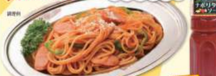
◎喫茶店の銀皿 ナポリタンソース 170

国産たまねぎと バターを使用。かけて 炒めるだけ! 昔懐かしい ナポリタンのできあがり