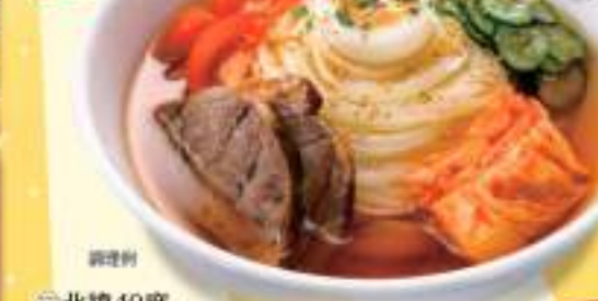
◎北緯40度 盛岡冷麺 R-10 171