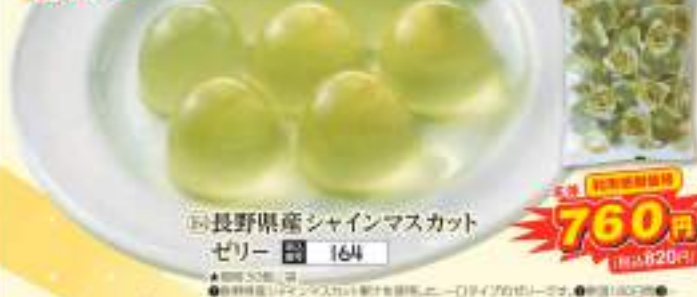
◎長野県産シャインマスカットゼリー 164