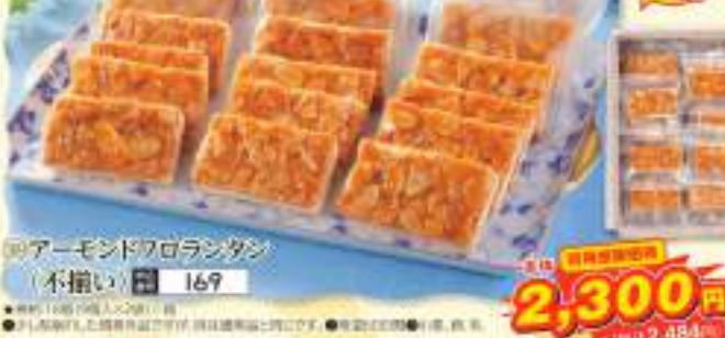
◎アーモンドフロランタン (不揃い) 169