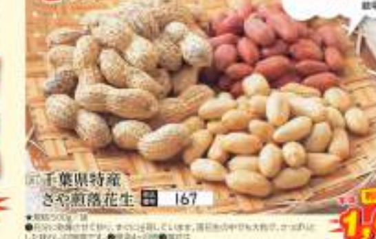
◎干菓果特産 さや煎落花生 167