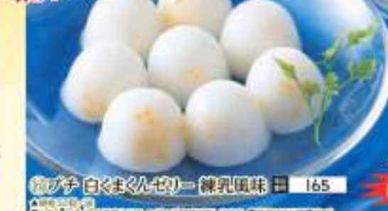
◎プチ 白まくんゼリー 練乳風味 165