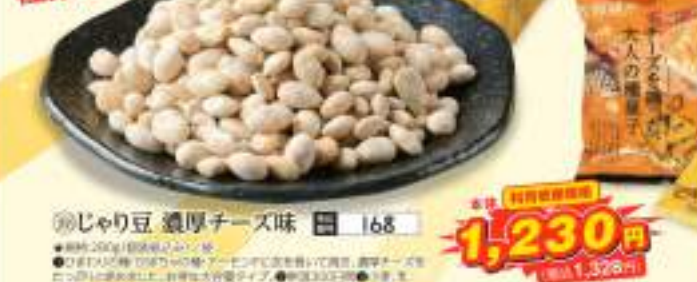
◎じゃり豆 濃厚チーズ味 168