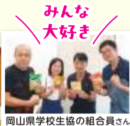
岡山県学校生協の組合員さん