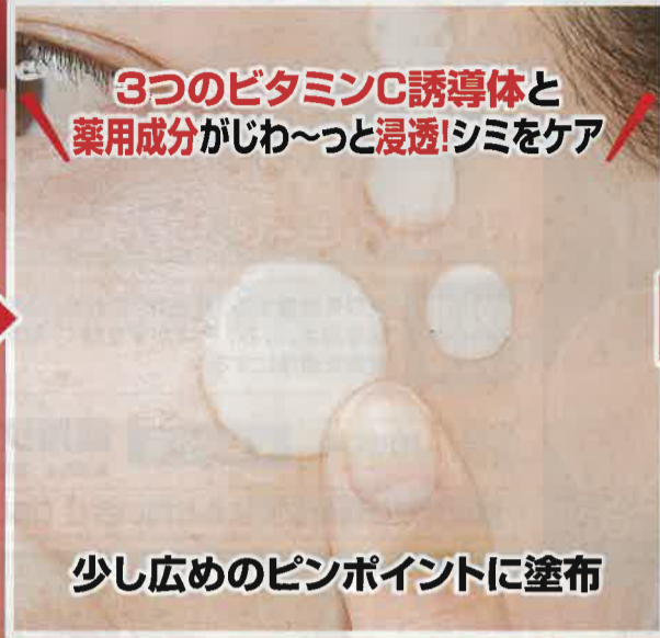
少し広めのピンポイントに塗布