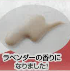
ラベンダーの香りに なりました!