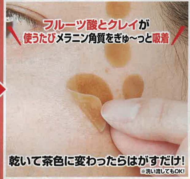
乾いて茶色に変わったらはがすだけ!