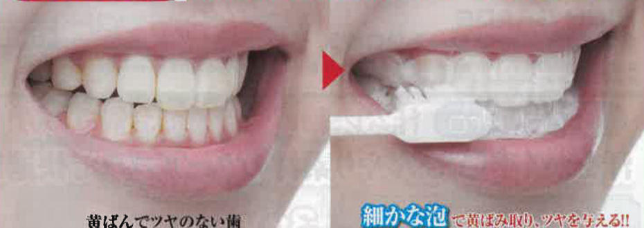
黄ばんでツヤのない歯